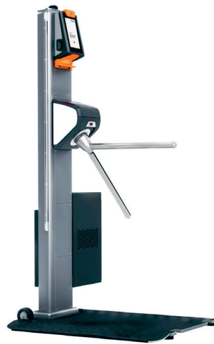
AX500 Smart Gate NG Palette mobile, WIFI et batterie