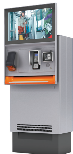
Axess TICKET KIOSK 600

Nach dem Bau von MEETT beauftragte Toulouse Évènements Axess mit der Installation eines Systems zur Verwaltung der Besucher und Aussteller auf dem gesamten Gelände. Dank der umfangreichen Erfahrung auf dem Gebiet der Zutrittskontrolle schlug Axess eine innovative Gesamtlösung vor, die die Hard- und Softwareanforderungen des neuen Messezentrums optimal erfüllen konnte. Die Lösung verwaltet den Ticketverkauf, die Ausstellerausweise, den Zugang zu den Besucher- und Ausstellerparkplätzen sowie die Zutrittskontrolle zu den Hallen in einem All-in-One-System. Bei den Hardwarelösungen installierte Axess 10 Axess