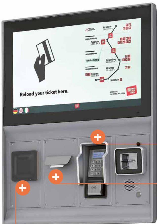
Axess SMART PAD 600 Rechargement des titres