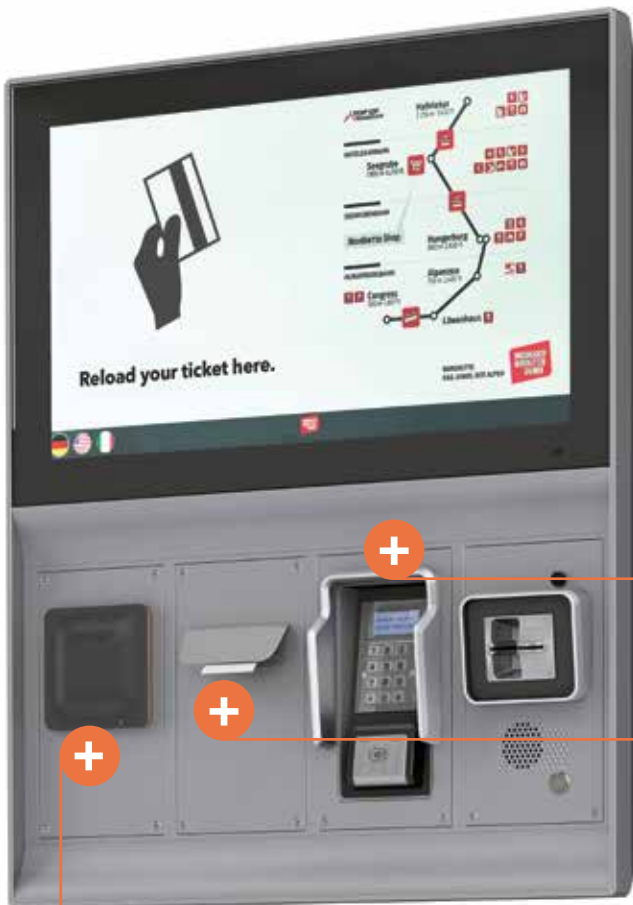
Axess SMART PAD 600 Recarga de pases.