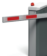
Car Axess Gate