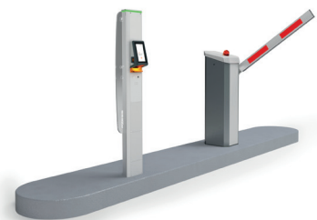
Car Axess Exit Gate