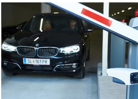
License Plate Recognition