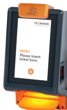
Axess SMART SCANNER 600

Grâce au logiciel de gestion central d'Axess, il suffit de quelques clics pour adapter la gestion des visiteurs aux besoins des organisateurs. De plus, des rapports spéciaux ont été mis en place, ainsi que des interfaces vers Feratel et oeTicket pour les événements futurs.