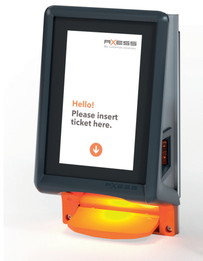
Axxess SMART SCANNER 600