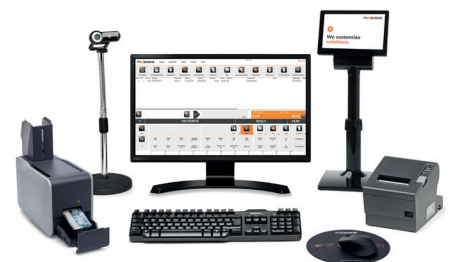
Axess SMART POS

des COVID-Konzeptes. Unter anderem wurden 10 mobile AX500 Smart Gates NG mit Mobile Palette und WIFI mit Axess SMART SCANNER 600 installiert sowie 7 Axess HANDHELDS .