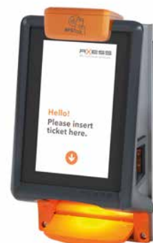
Axess SMART SCANNER 600 NFC