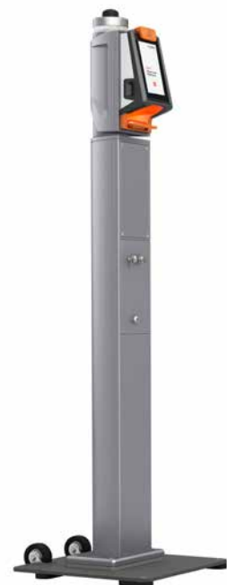
Axess SMART POST 600 NFC

„Zu Beginn der Corona-Pandemie haben wir uns intensiv mit der Umrüstung