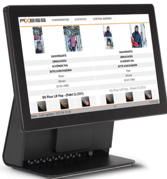
AX500レーンコントロールモニタ