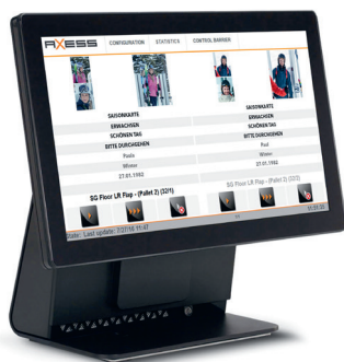
Axess LANE CONTROL MONITOR