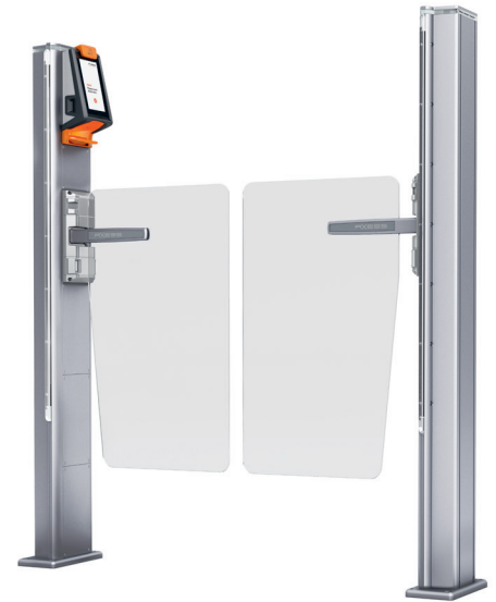
AX500 Smart Gate NG Flap Paddle Glass PMR

Lorsqu'une personne achète plusieurs tickets d'entrée en même temps, un QR code est généré pour chaque visiteur. Les QR codes peuvent être lus depuis un seul et même smartphone ou bien transmis séparément aux membres d'une famille ou aux amis. Cette manière simple et rapide de procéder permet ainsi d'éviter toute attente en caisse.