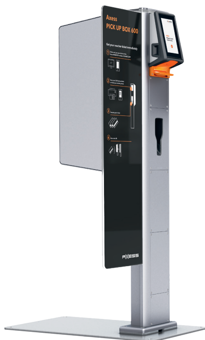
Axess PICK UP BOX 600

A l'image des grandes stations de ski, Myler Resort s'appuie elle aussi sur la vente en ligne et la vente sur site. L'Axess WEBSHOP est une solution de billetterie en ligne qui s'intègre facilement au site Internet du client, l'ensemble des caractéristiques et des produits nécessaires à la vente en ligne étant configurés via le système Axess. Peu importe où il se trouve, le client peut acheter à tout moment un forfait, ou tout autre produit proposé à la vente, via la plateforme en ligne. Une fois l'achat effectué, un bon d'échange électronique muni d'un QR code est envoyé au client. Ce dernier peut alors l'imprimer en tant que ticket Print@ Home ou l'enregistrer directement sur son smartphone. A son arrivée dans la station, le client n'a plus qu'à scanner le QR code sur une Axess PICK UP BOX 600 afin de retirer aussitôt son forfait.