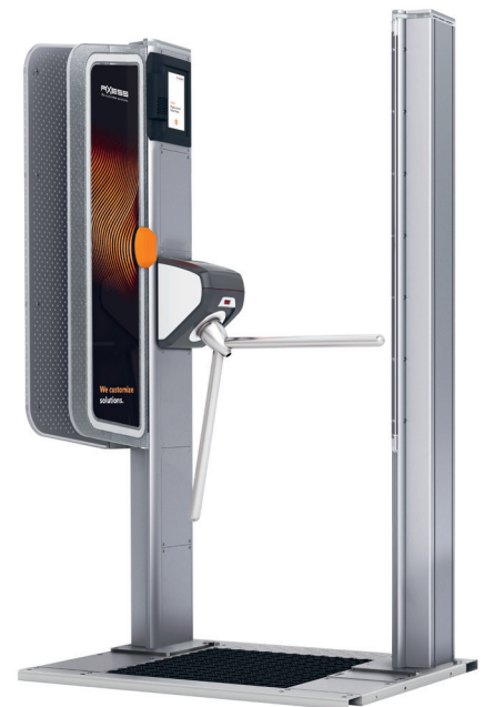
AX500 Smart Gate NG - Turnstile

été regroupés au sein d'un bâtiment en bois moderne. L'Axess RESORT.RENTAL assure le bon déroulement de la location du matériel de ski et de sport. Le service de retrait et de dépôt a été installé directement dans le magasin afin de faciliter le traitement des demandes. Le logiciel d'Axess, convivial et intuitif, permet ainsi de gérer de manière rapide l'ensemble des retraits, des retours, ainsi que des échanges du matériel. Le personnel dispose ainsi de toutes les informations nécessaires sur le client et peut suivre également en temps réel la gestion des stocks du magasin. Cette solution informatique intelligente permet aux opérateurs d'avoir une gestion professionnelle du stock, tout en offrant un service client de grande qualité. Le