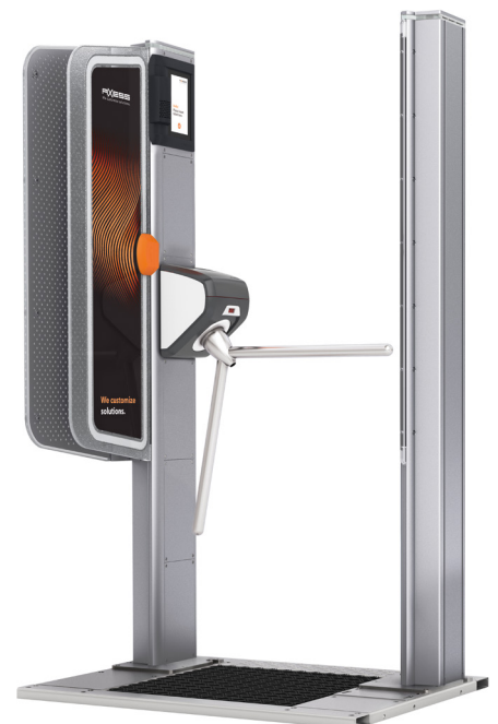
AX500 Smart Gate NG - Turnstile

Zudem ist für die Bezahlung der Leihgebühren die Axess SMART POS auf dem Tech Desk implementiert. Die Shop-Mitarbeiter verfügen über alle notwendigen Informationen zum Kunden und können in Echtzeit auf das Bestandsmanagement des Rental-