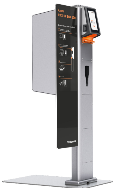
Axess PICK UP BOX 600

Nach erfolgreichem Kaufvorgang wird dem Gast ein digitales Ticket mit QR-Code ausgestellt. Im Myler Resort angekommen scannt der Sportbegeisterte den QR-Code des Tickets - entweder vom Smartphone oder Print@Home-Ticket - an der Axess PICK UP BOX 600 .