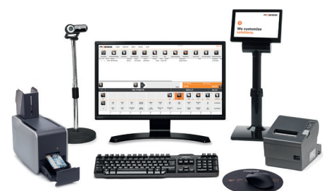
Axess SMART POS