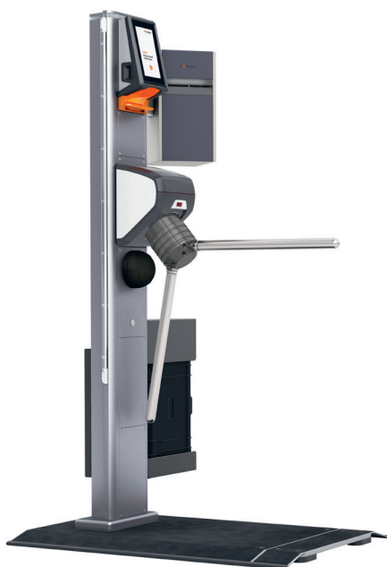
AX500 Smart Gate NG - Palette mobile

L'AX500 Smart Gate NG monté sur palette mobile peut être complété en option par un Axess BADGE BOX 600 . Grâce au titre acheté ou enregistré en