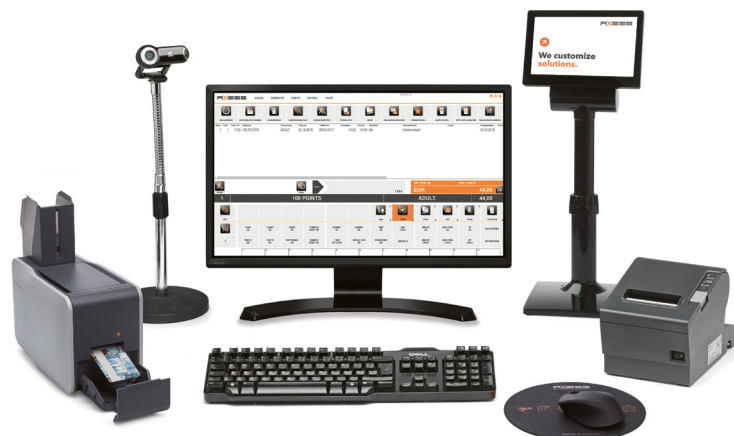
Axess SMART POS