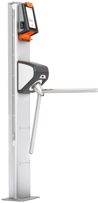
AX500 Smart Gate NG Turnstile

En la entrada, 14 AX500 Smart Gates NG Turnstile y 10 AX500 Smart Gates NG Flap ADA garantizarán un acceso rápido y sin contacto a las ruinas. Las AX500 Smart Gates NG utilizan un sensor para reconocer cuando se acerca un visitante con un ticket válido y activar la apertura de la barrera. Esto permite a los visitantes atravesar simplemente la puerta sin tocar el torniquete. La versión ADA de la AX500 Smart Gate NG Flap es especialmente adecuada para entradas anchas, como las necesarias para cochecitos de niños o usuarios de sillas de ruedas, gracias a los brazos giratorios extralargos. Los sensores de movimiento fotoeléctricos integrados también garantizan que los objetos pequeños que se lleven encima, como paraguas o bolsas, sean reconocidos y puedan pasar.