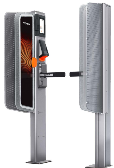
Axess Smart Gates NG - Flap

Bereits seit fünf Jahren ist das Tiroler Skigebiet mit den Axess Smart Solutions ausgestattet. An allen Seilbahnen wird der Zutritt mittels AX500 Smart Gates NG kontrolliert. Die flexiblen Gates können individuell an Kundenbedürfnisse angepasst und auch nachträglich adaptiert werden. Ob Turnstile- oder motorgestützte Flap-Module, es stehen alle Möglichkeiten offen. Durch die Modulbauweise können neue und bestehende Gates jederzeit um zusätzliche Module erweitert werden, z. B. mit dem