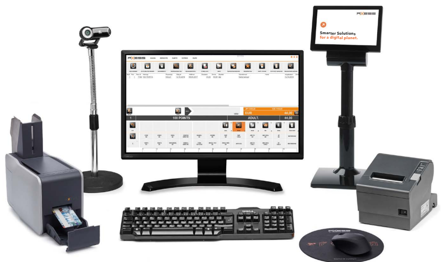
Axess SMART POS