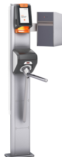
Axess Smart Gate NG con BADGE BOX 600

con AX500 Smart Gates NG - Mobile Palette y AX500 Smart Access Terminal NG para cada evento nuevo. Todos los accesos están fijados en pallets móviles para un posicionamiento independiente de la ubicación principal. Última