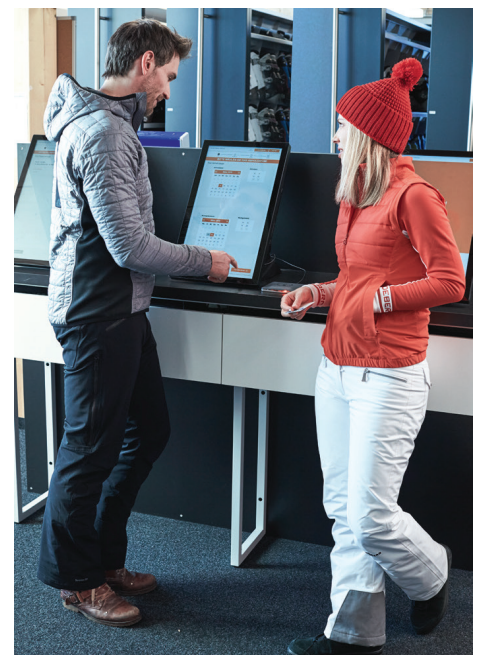
Axess TICKET KIOSK 600