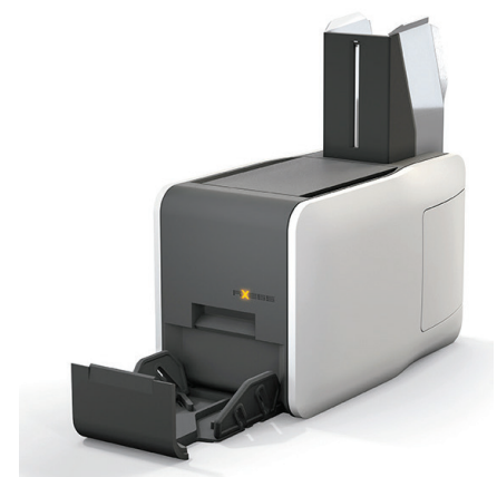
Axxess SMART PRINTER 600