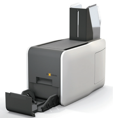
Axess SMART PRINTER 600