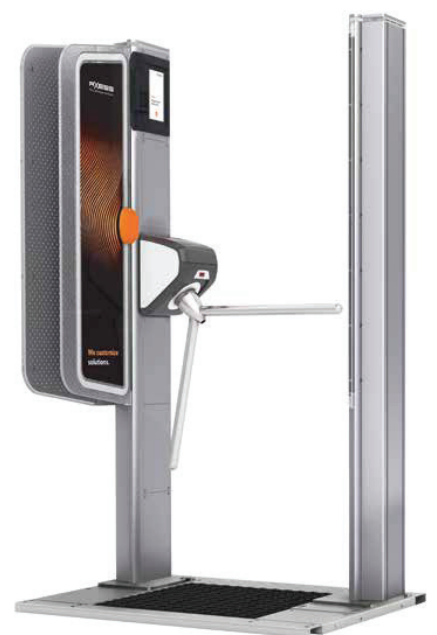
AX500 Smart Gate NG

Afin de compléter et d'harmoniser son système avant le début des Jeux Olympiques d'hiver de 2022, la station a choisi