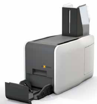
Axess SMART PRINTER 600