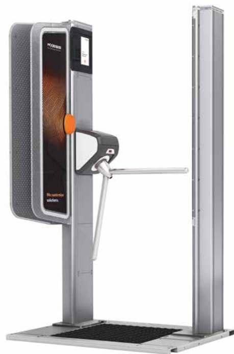
AX500 Smart Gate NG

Axess中国的王江琪表示：“考虑到长期发展，有必要建立一个数据库，分析每日客流量、销售数据和产品数据，以促进运营和管理，并进行战略规划。”她是该项目及负责冬季旅游行业的项目经理。