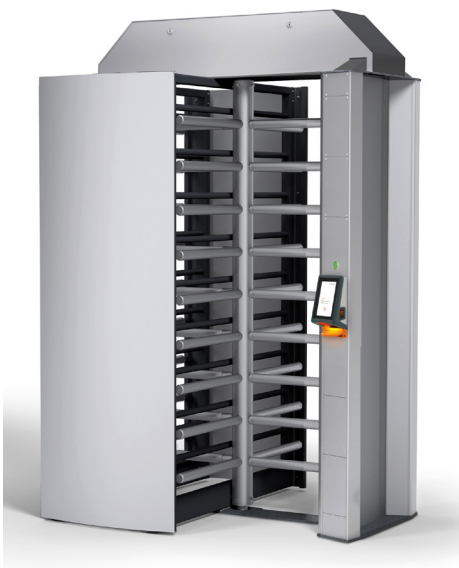
Axess Smart Security Gate

Für die Axess Niederlassung in Finnland ist dies das erste Projekt im Geschäftsfeld „Stadien / Arenen“.