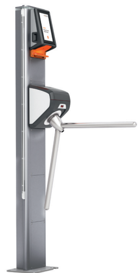
Axess Smart Gate NG Turnstile