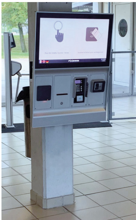
Axess TICKET FRAME 600

Die Axess Komplettlösung ermöglicht den Kunden, ihre Tickets sowohl online als auch am Automaten zu kaufen, ihre Abonnements selbst über die WTP-Nummer aufzuladen und über den Online-Zugang zu Axess SMART RESERVATION ihre Buchungen im Überblick zu sehen. Kunden können bereits von zu Hause aus jederzeit einen Tennis- oder Badmintonplatz in Vernier oder Aïre online buchen. Ausgezeichnet als das beste Schwimmbad des Kantons von Genf, sowohl für seine kundenfreundliche Infrastruktur als auch für seine großen Grün- und Schattenplätze, die im Sommer zum Spielen und Entspannen einladen, begrüßt das modernisierte Schwimmbad täglich zahlreiche Besucher aus der gesamten Region. Und mit der neuesten Axess Komplettlösung beginnt der Freizeitspaß ganz bequem bereits zu Hause.