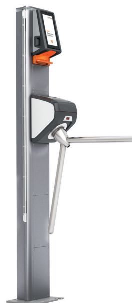
AX500 Smart Gate NG – Turnstile

gen – eine Rekordgeschwindigkeit, die für volle Kundenzufriedenheit sorgte. Neben einem Axess SMART POS Kassensystem hat sich das Schwimmbad von Lignon auch für den Self-Service-Bereich gerüstet: mit einem Axess TICKET KIOSK 600 und einem Axess TICKET FRAME 600 können sich die Besucher Tickets und andere Leistungen im Self-Service-Verfahren kaufen und somit eventuelle Warteschlangen an den Kassen umgehen. Der Zugang zur Minigolfanlage erfolgt über zwei Axess SMART LOCK 600. Die Zugänge zum Hallen- und Freibad wurden mit einem Axess SMART SECURITY GATE (doppelt) und mehreren Axess Smart Gates versehen. Die Schwimmbad-Besucher können nun ihre gültige Axess CARD oder ihren auf dem Smartphone ausgestellten QR-Code scannen, um das Gate zu öffnen. Im Zuge der Modernisierung