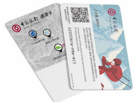
Smart Card TRW FULL

Um den Gästen ein komfortables Erlebnis zu bieten, wurden die Skigebiete mit