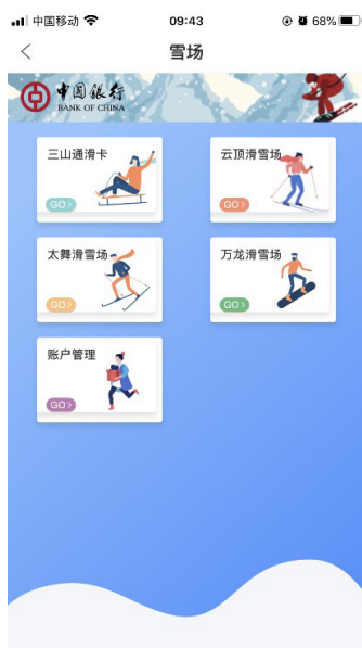
Bank of China Official App

des bereits vorhandenen Tickets beim Kauf eingegeben und somit ist es erneut gültig.