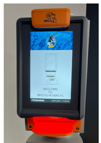
Zusätzlich zu den nachgerüsteten Scannern verfügen die Bristol Rovers über Handschanner für barrierefreie Eingänge und VIP-Bereiche.