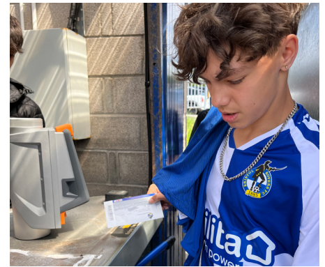
Die Scanner unterstützen Papier-, RFID-, NFC und mobile Tickets.

Dank der direkten Verknüpfung von Ticketing und Zutritt, kann die Verwaltung aus einer Hand realisiert werden, womit sich für uns im Club die Abläufe wesentlich reibungsloser gestalten. Zu Beginn der letzten Saison hatten wir mit einigen Herausforderungen zu kämpfen und es hat uns viel Arbeit gekostet, zwischen den verschiedenen Unternehmen, mit denen wir gearbeitet haben, zu wechseln. Die Zusammenarbeit mit Ticketmaster und Axess war essentiell, um uns wieder dorthin zu bringen, wo wir sein sollten - und jetzt, da wir mit dem neuen System weitermachen, bin ich zuversichtlich, dass wir unseren Fans in der aktuellen Saison einen Service bieten können, der ihre Erwartungen übertrifft."