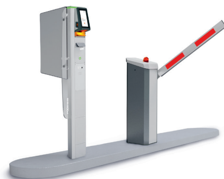
Car Axess NG

Si l'on décide de transformer les parkings de Valthoparc en galerie d'art contemporain afin de les faire entrer dans la modernité, alors autant moderniser l'ensemble du système d'accès pendant qu'on y est. C'est ici qu'Axess entre en scène en tant que fournisseur de solutions globales. Valthoparc lui confie ainsi la gestion et l'installation d'un système de billetterie et de contrôle d'accès pour les cinq nouveaux parkings qui viennent compléter le complexe déjà existant : P4 et Slalom à Val Thorens, ainsi que Croisette, Croisette Couvert et Bruyères aux Ménuires. Les travaux d'installation ont débuté à l'automne 2022 et se sont terminés en décembre. Durant cette période, Axess a installé 5 Car Axess NG ENTRY et 6 Car Axess NG EXIT , la plupart des parkings étant dotés d'une en-