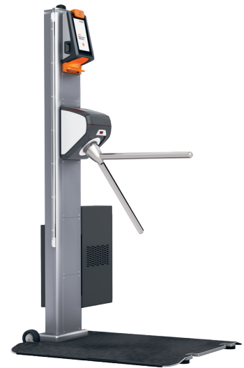
AX500 Smart Gate NG - avec palette mobile, module WIFI et batterie