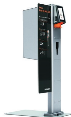
Axess PICK UP BOX 600