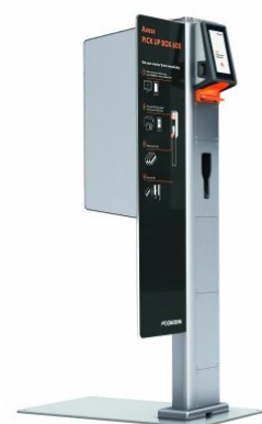
Axess PICK UP BOX 600

Der Vorteil fürs Skiresort-Management liegt auf der Hand: Alle Verkäufe sowie die Organisation sämtlicher Teilbereiche im Resort geschehen nun mit deutlich we-