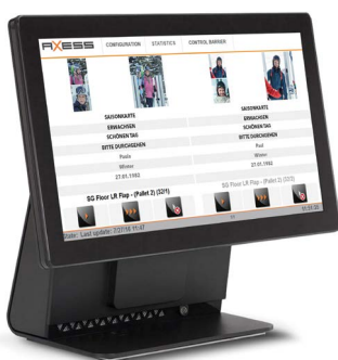
AX500 Lane Control Monitor