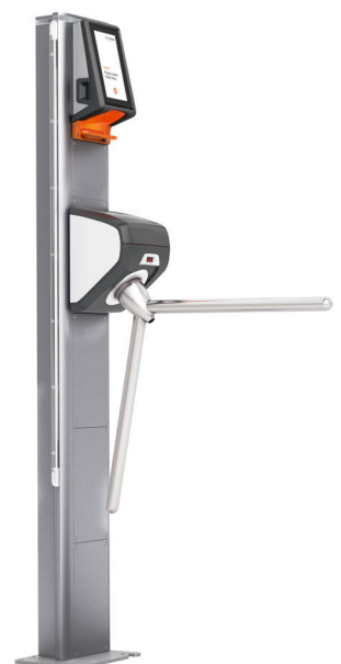
Axess Smart Gate NG

tiene una afluencia extremadamente alta con más de 250 eventos por año y, a veces, varios eventos por día. Para garantizar a los operadores una gestión de visitantes fluida y segura se instaló, por primera vez, una entrada y salida bidireccional en todas las puertas. Esto permite que los asistentes puedan abandonar el estadio directamente al final del evento ya que las puertas solo permiten la salida y la entrada queda bloqueada. La integración de Axess Smart Gates tanto en el concepto de emergencia que tiene el estadio como en el sistema de gestión del edificio es una novedad y ha aumentado la versatilidad en lo que se refiere a la gestión y la seguridad de los visitantes. Para los visitantes con diversidad funcional también se instalaron entradas más anchas para brindar un acceso cómodo y sin barreras.