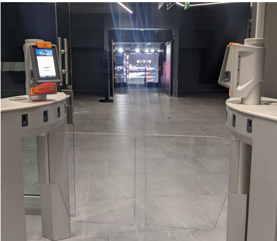
Axess SMART DOOR 600