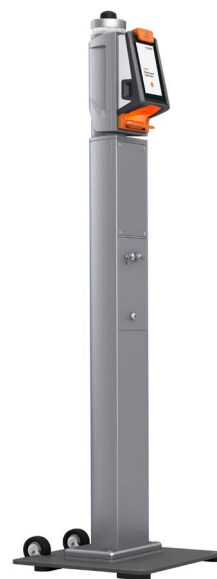
Axess SMART POST 600 NFC